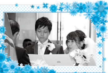
▲昨年実施した届け出挙式の様子