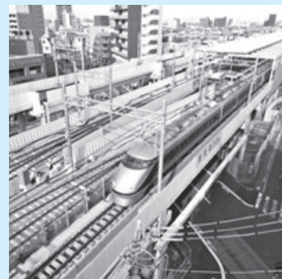
▲上下緩行線の高架化工事中

今後、引き上げ線の高架化や仮設ホームの撤去工事などを令和5年度末までに行う予定です。 くわしくはコチラ▶