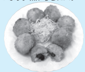
中の具材はお楽しみ!

「あだちはじめてえほん」の引き換えはお済みですか ■対象=1歳6カ月児健診受診対象の子と保護者 ※健診の通知に引換券を同封 ■内容=5冊の絵本の中から1冊をプレゼント ■引き換え期間=受診指定月から1年間 ※引き換え場所など、くわしくは区のホームページをご覧ください。 ■問先=中央図書館 読書活動推進係 ☎5813-3745