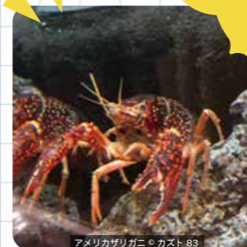
アメリカザリガニ 83

飼っている生きものは最後までお世話をして、海外の生きものはもちろん、日本の生きものも外に逃がさないようにしましょう。