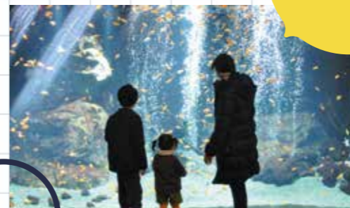
足立区生物園・金魚の大水槽