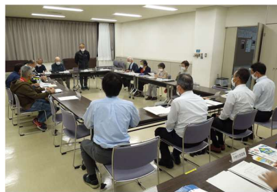
■第83回協議会の様子