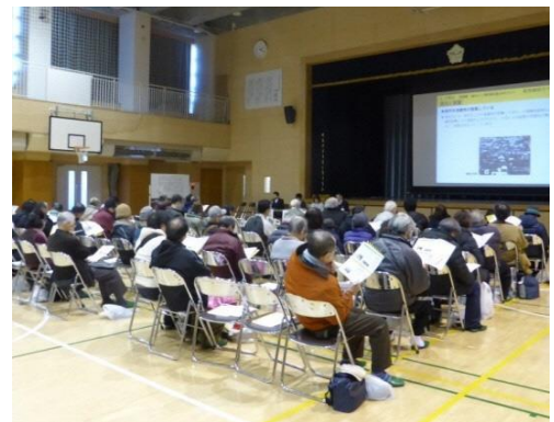
説明会のようす（千寿双葉小体育館）

今後、防災まちづくり計画実現のためのルールである「地区計画」の決定に向けて、皆様との意見交換を進めていきます。