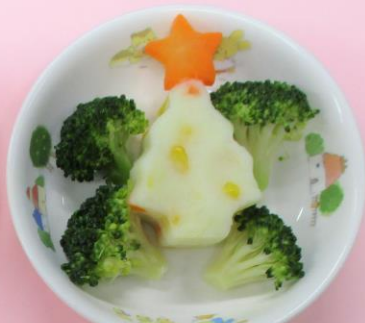
ポテトサラダとブロッコリー