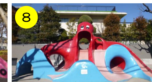
【千住ほんちょう公園（千住4-22-16）】 ツートンカラーが珍しいタコさん。青は海の波を表しているとの説が…？