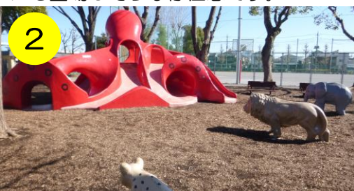
【北鹿浜公園（鹿浜3-26-1）】 タコさんの目の前に、ゾウやライオンが…果たして海と陸の勝負はいかに？