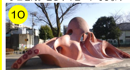
【東谷中公園（東和5-1-9）】 ザ・王道のタコさん。シンプルで飽きのこない親しみやすいデザインです。