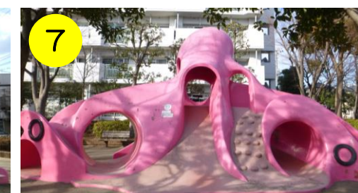
【扇なかよし公園（扇3-9-4）】 小さい公園に巨大なタコさん。興野ふれあい公園のタコさんと兄弟かな？