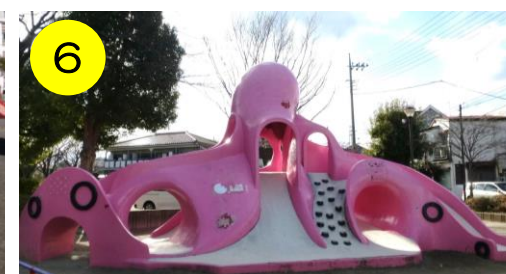
【興野ふれあい公園（興野2-28-25）】 ピンクが眩しいタコさん。あれれ？何処かで見たことがあるような… →