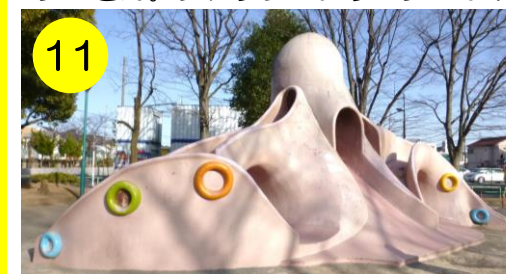
【一ツ家中央公園（一ツ家3-15-1）】 カラフルな吸盤がチャームポイントのタコさん。どう？キュートでしょ？