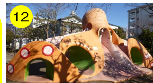
【水神橋公園（保木間5-32-4）】 オレンジに緑のアクセントがお洒落なタコさん。ファッションリーダーか？