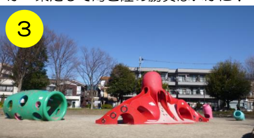
【上沼田北公園（江北7-16-1）】 タコ壺付のタコさん。区内で一番海の再現度が高いこだわりの公園です。