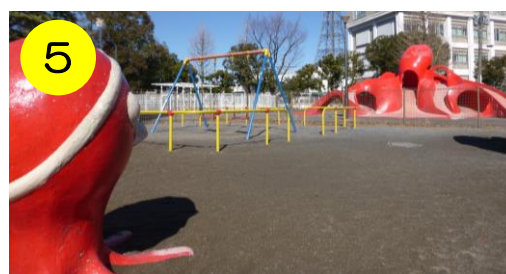
【新西新井公園（西新井5-17-1）】 ミニダコがいる公園です。ミニダコがタコさんと遊ぶ子を優しく見守ります。