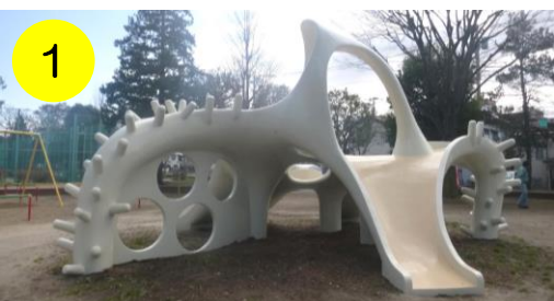
【入谷中央公園（入谷4-16-1）】 区内唯一のイカすべり台。アニメ映画にも登場しそうな存在感です。

区内には、 11体のタコさんと1体のイカさん のすべり台があります。一口に「タコさんすべり台」と言っても、どれも個性的でまったく一緒のものはありません。区内に散らばるタコさんとイカさんに、会いに行ってみませんか？