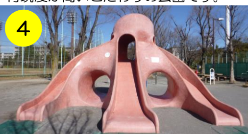
【上沼田東公園（江北6-10-1）】 区内で一番コンパクトなタコさん。小さくても楽しさは変わりませんよ！