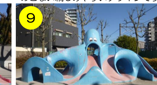
【千住東町公園（千住東2-20-17）】 全身真っ青なタコさん。クリクリの目も可愛く、ひょうきんな面持ちです。