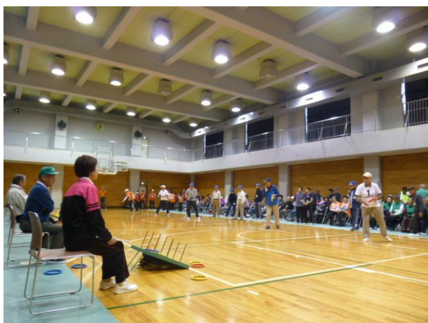
輪投げ大会の様子