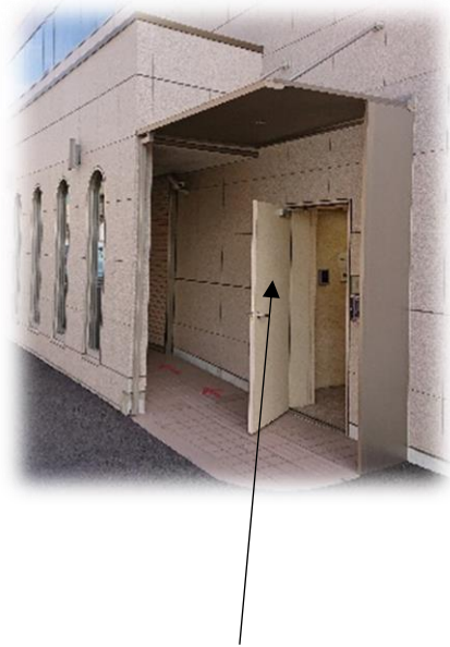
【医師会館 1F イメージ】