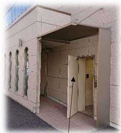
【医師会館 1F イメージ】