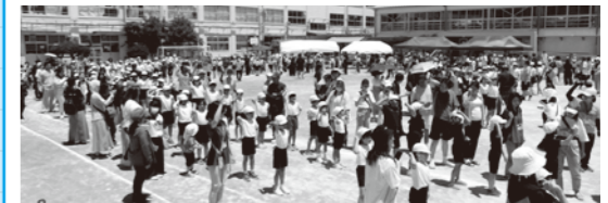
5月30日の運動会では、児童と一緒に保護者や地域の方も踊りました。

花西もりあげ隊が花畑西小の全員から募集した言葉を選んで歌詞を作り、1年生でも自然に体が動く簡単な振り付けを全員で考えました。練習時間が短くても全員で楽しく踊れる、子どもたちの力で仕上げた作品です!