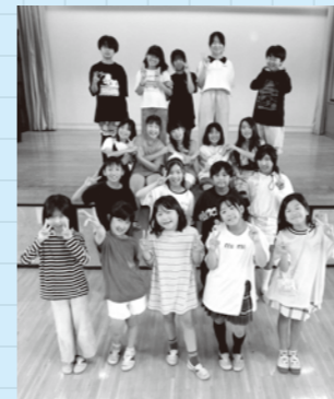
現在25人の メンバーで活動中!

昨年、有志の児童を募り、「花西もりあげ隊」を結成しました。児童主体で休み時間に遊ぶ活動を企画立案しています。