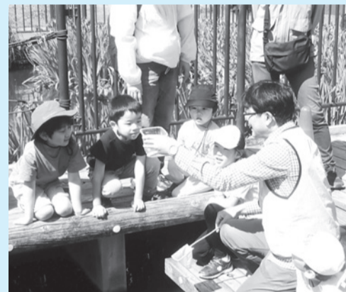
▲自然を楽しむきっかけを一緒に提供しませんか?

■日程=8年8月29日～9年3月31日に8回実施 ※時間などくわしくは事前説明会でお知らせします。