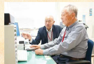
▲保護司会のホームページを編集している様子