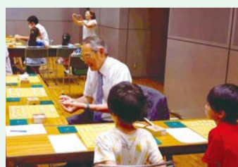
▲将棋の所作を教わる様子

日時=7月25日(土)、午後1時~4時 対象=区内在住・在学の小学生と保護者 ※初心者も可 内容=プロ棋士から将棋の所作を学ぶ/参加者同士の対局(プロ棋士との対局あり)など 定員=40組(抽選) 申込=区のホームページからオンライン申請 期限=7月14日(火) 申込先=(区)民生係 問先=(公社)日本将棋連盟「足立区ふれあい将棋教室」係 gakkou@shogi.or.jp