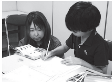
▲生きものをじっくり観察してスケッチしよう!

11時30分/午後2時～3時30分 ■対象=小学生 ■内容=園内で捕まえた生きものをスケッチして、オリジナルの図鑑を作る ■定員=各10人(抽選) ■申込=窓口/全員の住所・氏名(フリガナ)・年齢(学年)・電話番号・ファクス番号、希望時間(第2希望まで)、「つかまえて観察生きもの図鑑作り 夏編」を記入しファクス・往復ハガキで送付 ※往復ハガキは返信面にも宛名を記入。1人1回のみ申し込み可 ■期限=6月30日(火)必着 ■場・申・問先=桑袋ビオトープ公園 ☎3884-1021 ☎3884-1041