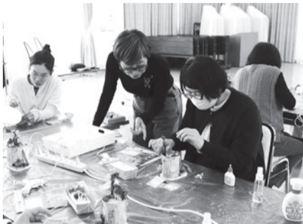
▲細かな作業が楽しい!

■日時=7月4日(土)、午前10時30分～正午 ■対象=4歳以上の方 ※4歳～小学生は保護者同伴 ■内容=プリザーブド加工を施したカスミノウやセンニチコウなどで、鉢の中に小さな庭を作る ■定員=10人(6月13日、午前9時から 先着順 ) ■費用=3,300円(材料費など) ■申込=電話/氏名(フリガナ)、年齢(学年)、電話番号、「箱庭アート」を記入しファクス ■期限=6月27日(土) ■場・申・問先=桜花亭 ☎3885-9795 ☎3860-0608