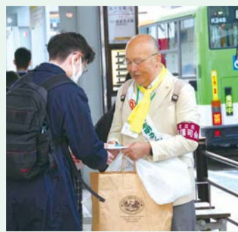
▲啓発グッズを配る様子

4月17日の「国際更生保護ボランティアの日」に、本運動の一環として区内8駅でキャンペーングッズを配布。保護司やボランティアの皆さんが、尽力しました。