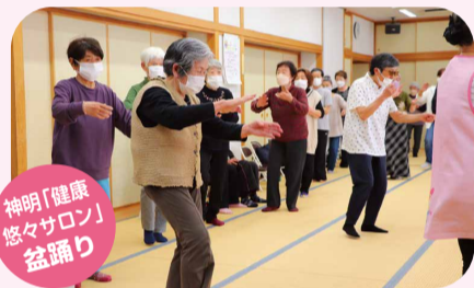
神明「健康 悠々サロン」 盆踊り