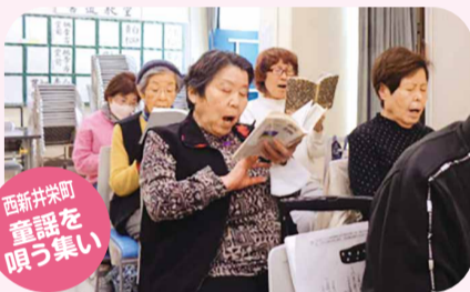
西新井栄町 童謡を 唄う集い