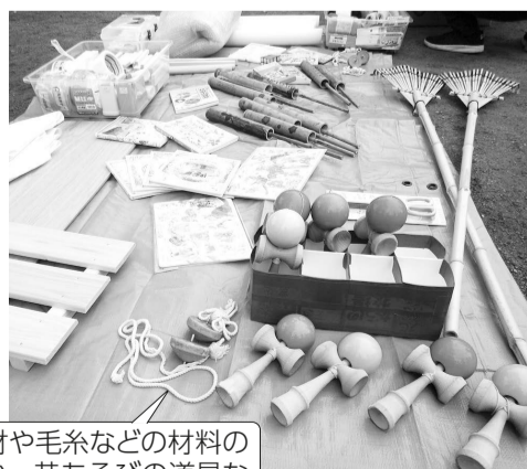
表2 移動式プレーパーク「ぼうけんあそび」 場所等