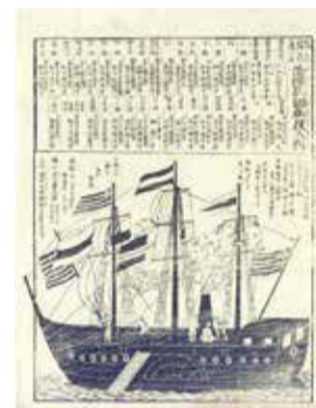
黒船来航を伝えています