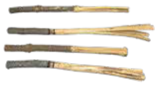
▲粥占の道具「粥柱」(長さ35～40cm)

粥占とは、小豆粥を炊き、そこに粥柱と呼ばれる木の棒をさしこんでかき混ぜ、先についた米粒の量などから1年の吉凶を占う行事です。寄贈者が取材した花畑の家では、「粥柱にたくさん米粒がついたら、米がよく穫れる」と伝わっていたそうです。(取材・撮影・寄贈：品川区文化財保護審議会委員 佐藤高氏)