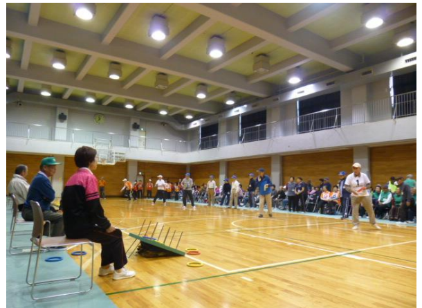
輪投げ大会の様子