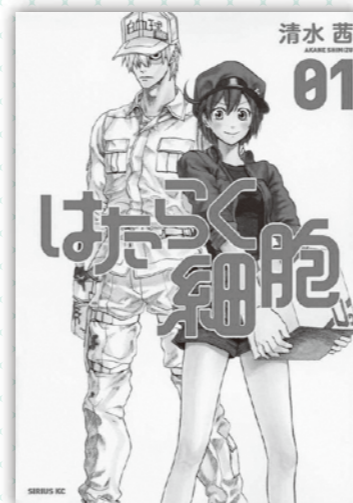
はたらく細胞 清水茜/著 講談社