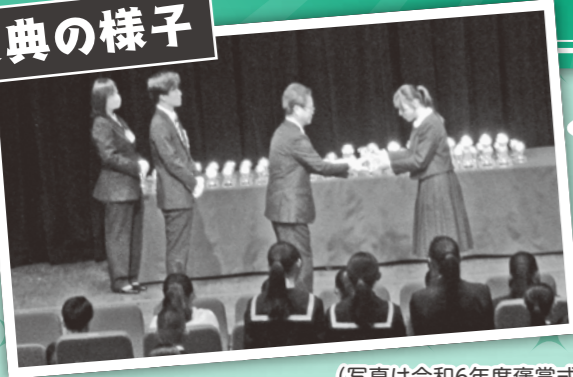
(写真は令和6年度褒賞式)