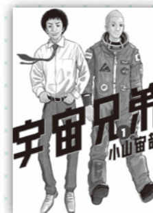
宇宙兄弟 小山宙哉/著 講談社