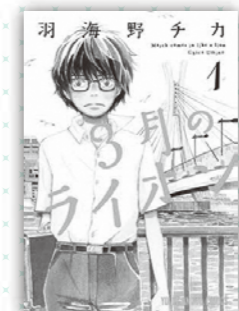
3月のライオン 羽海野チカ/著 白泉社

これまで所蔵してきた学習マンガに加え、「学習に役立つ作品」「足立区ゆかりの作家・舞台の作品」などを新たに収集します。ぜひ足立区立図書館にお越しください!