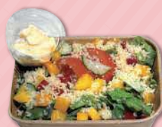
クスクスと彩野菜のサラダ 594円