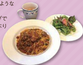
お肉ゴロゴロポロネーゼ(サラダ・スープセット) 1,900円

足立区大谷田5-15-14 ☎ 03-5856-2293 メイン料理のような贅沢パスタ! サラダとスープで野菜もたっぷり