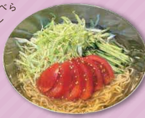
サラダラーメン 950円

足立区神明3-5-13 ☎ 03-3628-2661 サラダみたいなさっぱり食べられるラーメン