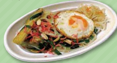
彩り野菜のパッタイ 880円