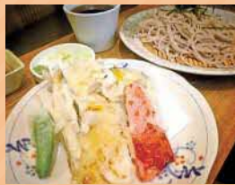
精進天ぷらと蕎麦セット 1,280円