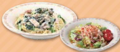
きのこほうれん草のクリームスパゲッティ +小エビのサラダ 950円