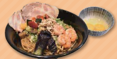
スタミナまぜそば 1,300円