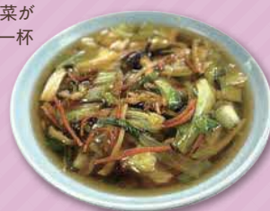
推しベジ肉絲湯麺 1,100円

足立区神明南2-7-18 ☎ 03-3605-6094 人気の肉そばにたっぷり野菜! 美味しく野菜が食べられる一杯