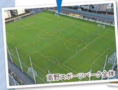
高野スポーツパーク全体