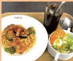
茄子とベーコンのトマトソースパスタ サラダドリンクセット 1,280円