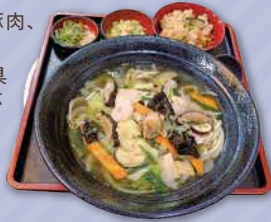
スタミナうどん ※かやくご飯はプラス料金 1,000円

足立区栗原3-25-13 ☎ 03-3890-9540 9種の野菜に豚肉、帆立とエビ! ごま油が香る具だくさんの一杯