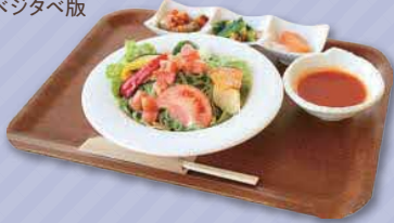
あだち菜うどん (“ベジタベ”サラダうどん) 1,200円

足立区鹿浜2-44-1 足立区都市農業公園 ☎ 03-3853-4114 足立区産の小松菜を練り込んだ、あだち菜うどんのベジタベ版