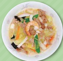
野菜たっぷりチャンポン麺 700円