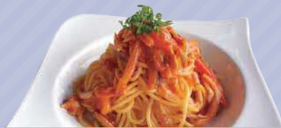
バスク風パプリカと鶏のトマトソースパスタ 1,680円

足立区竹の塚1-13-16 フラット竹の塚1F ☎ 03-5856-7945 甘熟トマトと彩り野菜で煮込んだ、鶏の旨味溢れる濃厚トマトパスタ