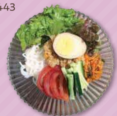
ぴよちー特製 野菜たっぷりグルテンフリー冷麺 800円 ※月曜・水曜のみ提供予定

足立区西加平2-7-7(アラコスコ駐車スペース) ☎ 090-6652-8443 発酵調味料と季節のお野菜でつくる優しい冷麺