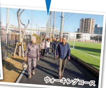
ウォーキングコース