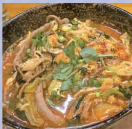
ユッケジャンラーメン 1,089円

足立区栗原1-12-23 ☎ 03-5856-6885 食欲をそそる! 野菜たっぷりピリ辛ラーメン