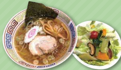
中華そばとミニサラダセット 1,023円