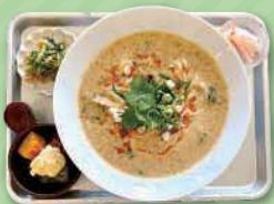
豆乳担担風米粉うどん お野菜たっぷりプラス 1,595円