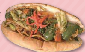
野菜のをきそばコッペ 421円