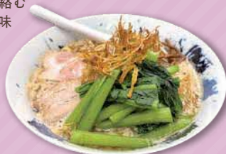
松麺(小松菜トッピング) 1,100円

足立区神明南2-7-28 ☎ 070-9015-3203 豚骨と鯉節のハーモニー! 中太麺が絡む 香り高い味