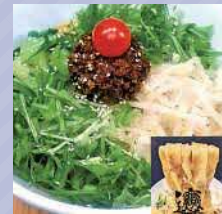
ビャンビャン麺 1,100円

足立区栗原1-18-8 ☎ 03-5856-5368 たっぷり野菜と挽肉の幅広ませそば! 麺は冷・ぬる・熱から選べる