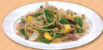
パスタ オルトラーナ 1,650円