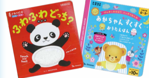
「ふわふわどっこ?」「あかちゃんすくすくおうちえほん」