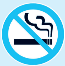
▲喫煙状況の店頭表示(店舗入口用)