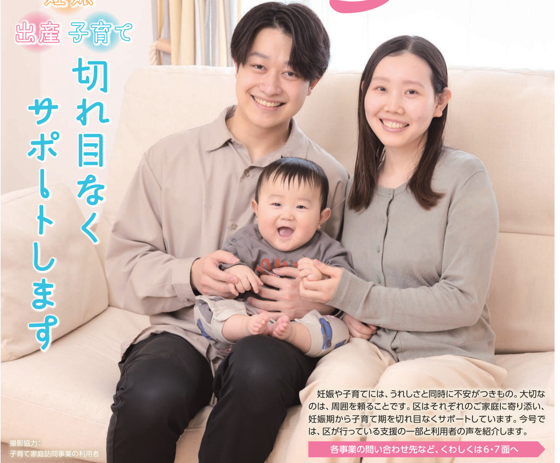
撮影協力: 子育て家庭訪問事業の利用者

妊娠や子育てには、うれしさと同時に不安がつきもの。大切なのは、周囲を頼ることです。区はそれぞれのご家庭に寄り添い、妊娠期から子育て期を切れ目なくサポートしています。今号では、区が行っている支援の一部と利用者の声を紹介します。