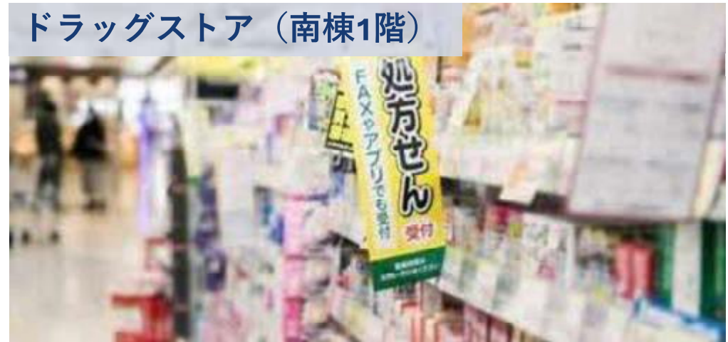
ドラッグストア（南棟1階）