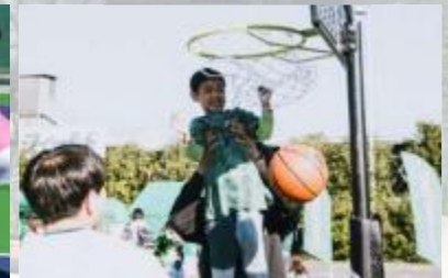
3×3バスケットボール