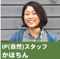
IP(自然)スタッフ かほちん