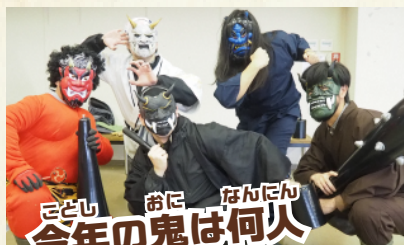
としのう 今年の鬼は何人 来るかな？