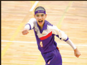
▲渚江中学校 バレーボール部で活躍★1

3年生の全国大会では、エースの選手が怪我で離脱し、僕が攻撃の中心を任されました。「仲間がつないでくれたボールは絶対決める」と思いながらスパイクを打ち、決勝戦はフルセットで逆転勝ち。勝利への強い思いと最後まで諦めない気持ちが優勝につながったと思います。