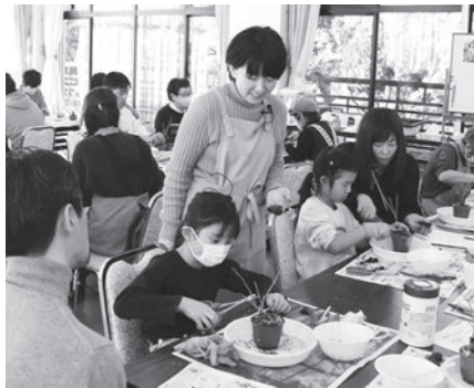
▲初心者でも気軽に楽しめます！

日、午前9時から先着順)■費用=3,500円(材料費など)■申込=電話／氏名(フリガナ)、年齢(学年)、電話番号、希望時間、「盆栽作り」を記入しファクス■期限=2月3日(火)