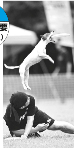
▲ディスクドッグデモンstrーションの様子