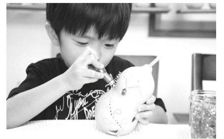
▲好きなデザインでつくろう！

前9時から先着順) ※小学生以下の方は保護者同伴 ■費用=3,300円(材料費など) ■申込=電話/氏名(フリガナ)、年齢(学年)、電話番号、希望時間、「ひょうたんライト」を記入しファクス ■期限=11月20日(木) ■場・申・問先=桜花亭 ☎3885-9795 ☎3860-0608