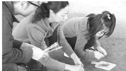
▲火おこしを体験して災害に備えよう！

など) ■申込=不要 ※当日午前9時から会場で受け付け ■場・問先=都市農業公園 ☎3853-4114