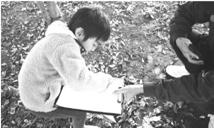
▲葉っぱの形を観察してみよう！