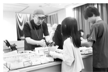
▲みどりのあそびば「夏休みクラフト」の様子

「みどりのあそびば」や「みどりの学び場」の講座を形にして、参加者から「また参加したい」という言葉をいただけたときは、本当にやってよかったなとやりがいを感じます。