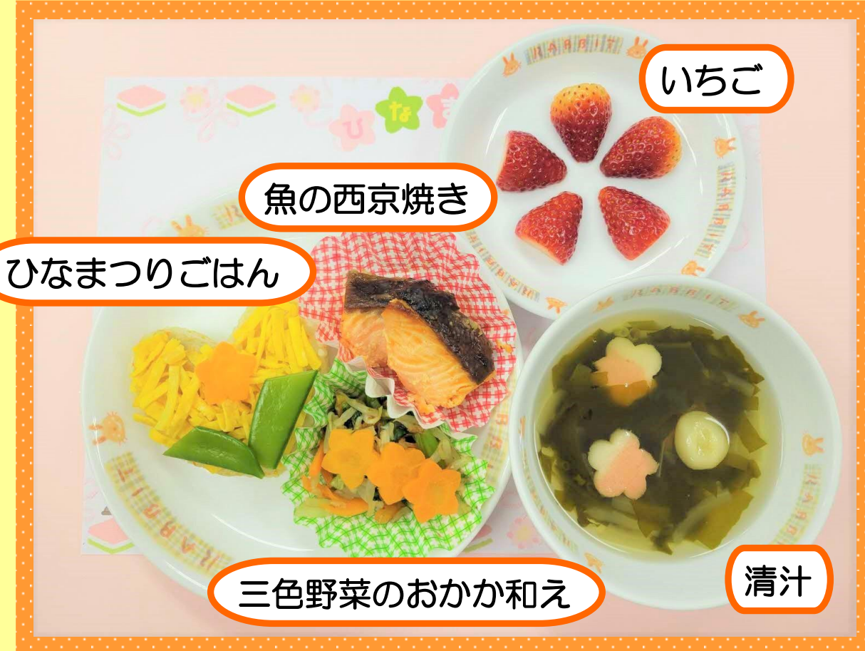
ひなまつりごはん