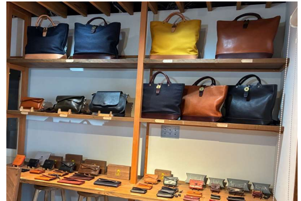
自社オリジナルブランド『BEERBELLY（ビール腹）』の商品がずらりと並んだ店内

A4: 自社オリジナルブランドの認知を広げる取り組みに力を入れていきたいと考えています。 今回作成したパンフレットもその一環で、ブランドやものづくりの背景を知っていただくきっかけになればと思っています。 今後も情報発信を強化し、より多くの方に知っていただけるよう取り組んでいきたいです。