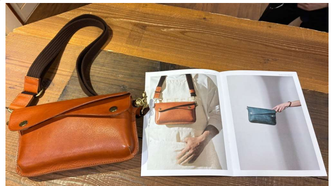
自社オリジナルブランドの商品（DOUBLE FLAPS SMALL）と、助成金を活用して作成したカタログ

A3: 申請手続きについては、特に難しいと感じる点はありませんでした。 担当のマッチングクリエイターにご案内いただきながら進めることができたので、比較的スムーズに申請を進めることができました。 また事業承継の計画書作りの中で、中長期的な課題が発見できました。 担当のマッチングクリエイターは今の事業内容を理解した上で、補助金の活用や実行的なアドバイスをいただけるので有難いです。