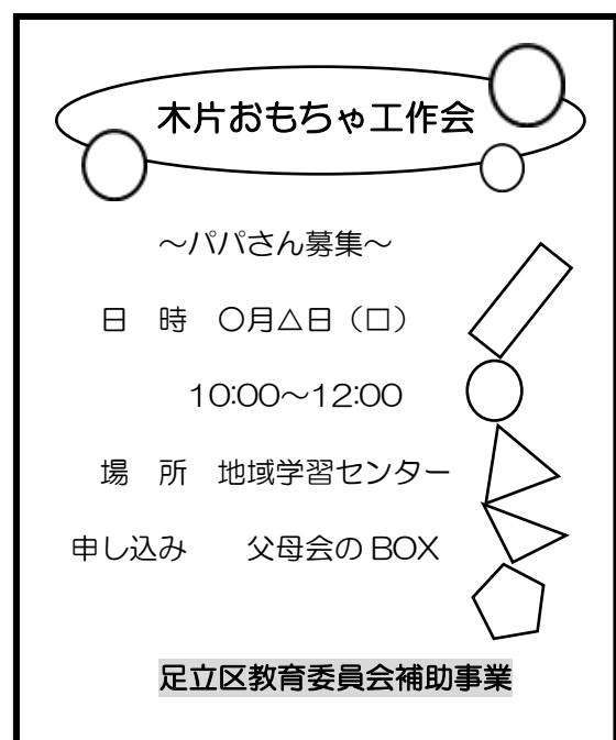
例) 交流活動チラシ・ポスター