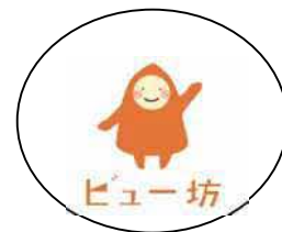
イメージキャラクター「ビュー坊」

※「ビューティフル・ウィンドウズ運動」とは、「美しいまち」 を印象付けることで犯罪を抑止しようという足立区独自の運 動です。区は、警視庁や区民のみなさんと協働して、まちの 美化活動や防犯パトロールなどの取り組みを推進し、犯罪の ない住みよいまちの実現をめざしています。