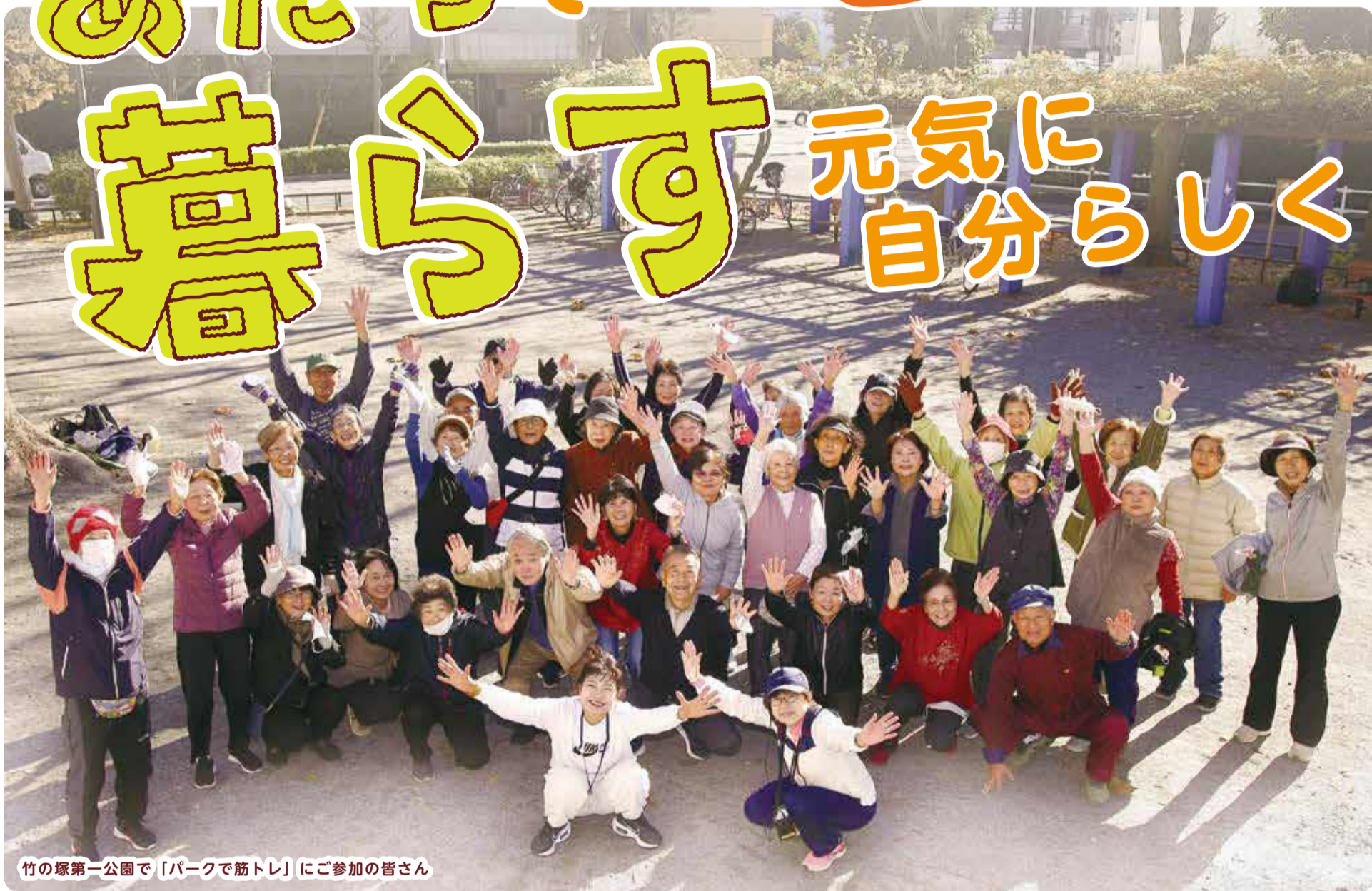
竹の塚第一公園で「パークで筋トレ」にご参加の皆さん