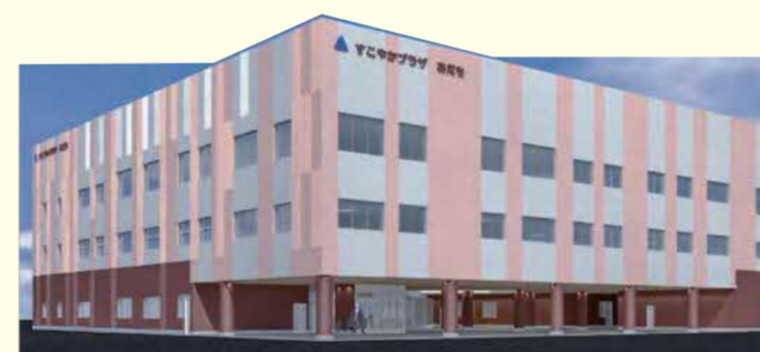
すこやかプラザあだち完成予想図(江北5-14) ※ 東京女子医科大学付属足立医療センター北側