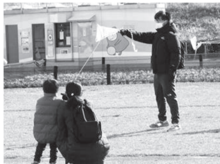
▲和紙と竹ひごでできた凧をあげよう