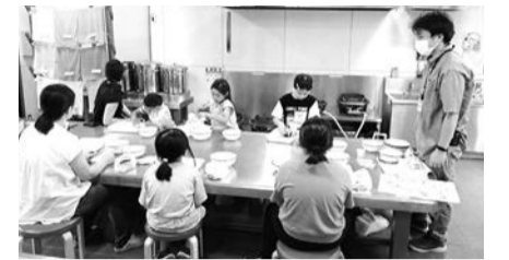
▲子どもでも楽しめる染め物体験です

終了 ■内容=サザンカの花びらから抽出した染液でハンカチを染める ※小学3年生以下の方は保護者同伴 ■費用=1回400円 ■申込=不要 ※時間内随時受け付け。最終受け付けは終了30分前 ■場・問先=都市農業公園 ☎3853-4114