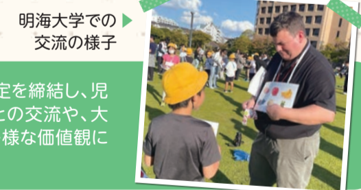
明海大学での交流の様子

外国語学部を有する明海大学(千葉県浦安市明海1)と協定を締結し、児童・生徒の英語力の定着と向上を図るため、外国人留学生との交流や、大学生によるオールイングリッシュのキャンパスツアーなど、多様な価値観に触れる交流会を行っています。