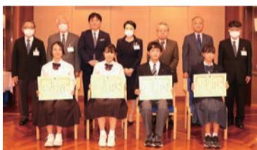
▲令和5年11月に開催された中学生の部表彰式の様子

区内の小・中学生を対象に、平成21年度から始まり、今までになんと合計7万6,647件のメニューの応募がありました! 子どもたちが考えたメニューは、どれもおいしそうで栄養バランスもバツグン! おいしい給食を毎日食べているからこそ、おいしいメニューがひらめくんですね!