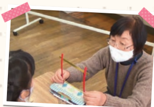
個別指導を行うそだち指導員

自分の苦手なところができるようになりましたか? 「はい」と答えた児童 97.9% (令和4年度「そだち指導アンケート」より)