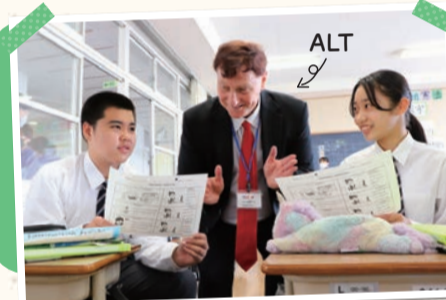
▲千寿桜堤中学校の授業の様子

聞く・読む・話す・書くを小学校から中学校にかけてバランスよく習得! 専門のアドバイザーやALT(外国語指導助手)*7が、英語によるコミュニケーション能力と表現力を育てる、より自然で実践的な授業づくりを支援しています。 ★7…小学校は年4日~14日、中学校は週2~3日派遣