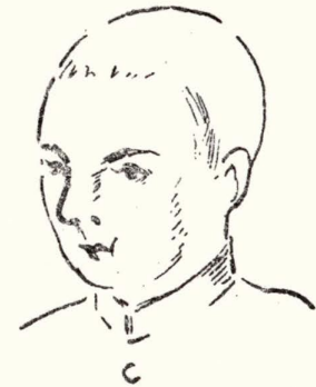
（納税義務のない者について）

問 私は17才です、兄は不具者ですが、やつぱり区民税を納めなければならぬのですか。