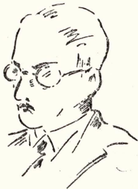
（納税義務者について）

即ち区民税とは、平たく言えば、足立区の住民が廣く行う区の諸行政、諸施策の経費を分担し、もつて区政への関心を高め、その発展への契機たらしめようという趣旨に立脚したものであつて、その性格は、いわば割勘的性格をもち、頭割りとも言うような税種なのであります。