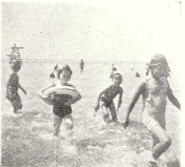
海 水 浴 場