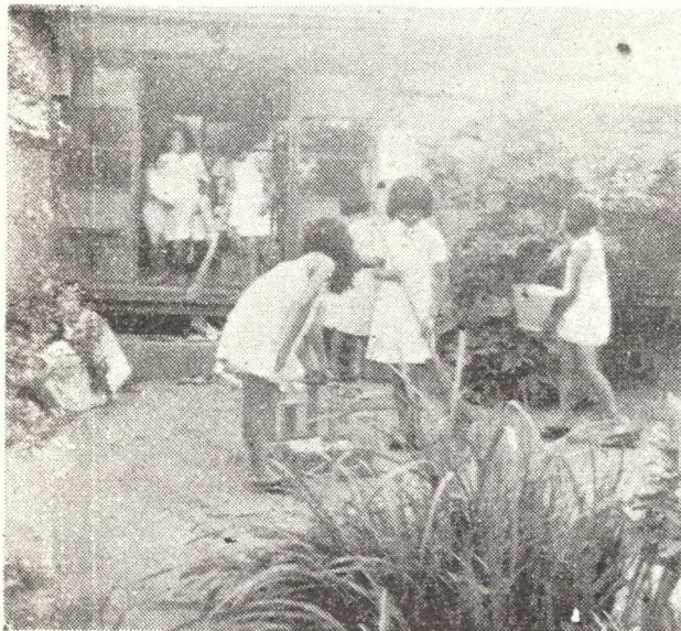
朝 の 掃 除