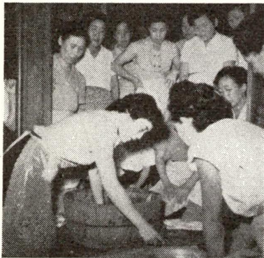
【寫眞は洗濯講習会】

ように、又マンホール、井戸及びプール、ドブ等の危険場所には危険の標示をしてあるが、十分注意しできるだけ道路の真中を歩くようにすること。