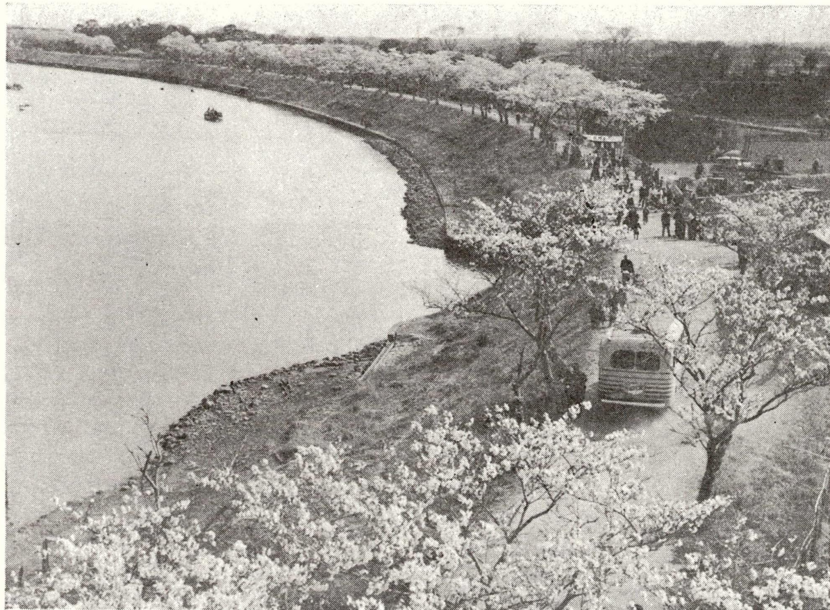
写真は、桜まつりでにぎわう中川堤