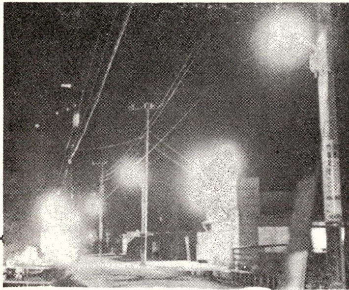
伊興町前沼の赤山街道にとりつけられた街路灯