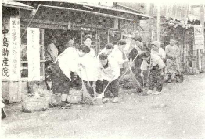
(清掃に励む婦人会の方々)

新生活運動足立区モデル地区の方々の協力を得て、四月十日の首都美化デーに、重点的清掃を行なうことになりました。場所は、北千住駅西口と東口、および千住一丁目と四丁目、千住旭町を中心とし