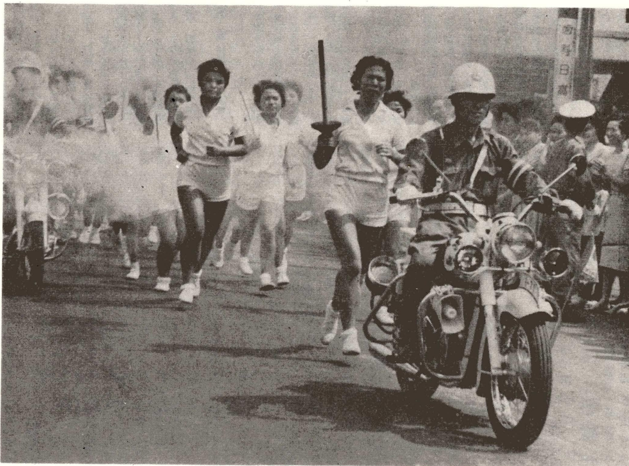
写真は、13日に行なわれた聖火リレーのリハーサル

第18回オリンピック東京大会まであと10日。全国をリレーされた聖火が、10月7日足立区に入ってきます。