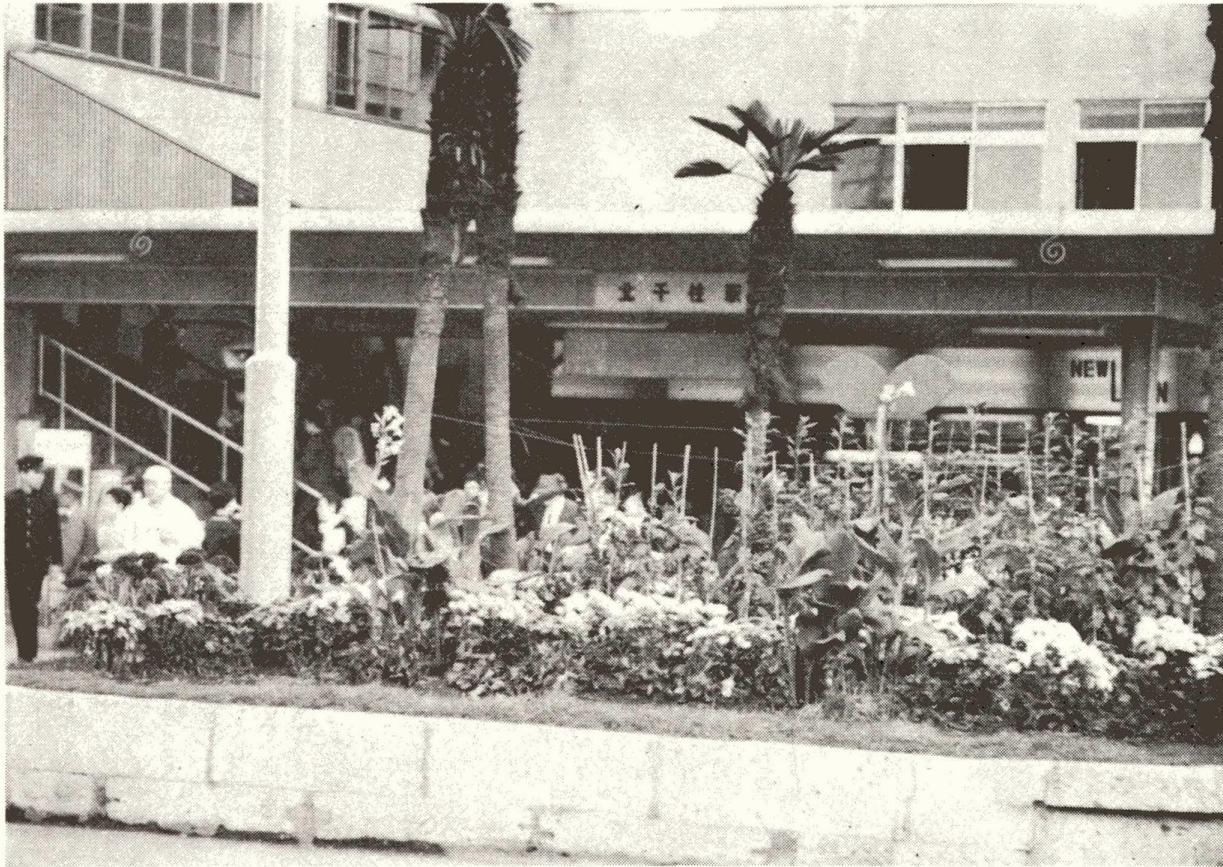
写真は花いっぱいコンクールで優秀賞を受賞した北千住駅前の花壇