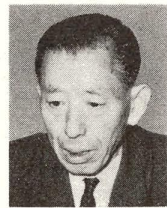
区民の福祉向上に

区議会議長として、今度の区長選任問題については、結果的には円満に解決しましたので、今後は区の理事者と歩調をそろえて、大足立区の建設に向けてゆきつづけていこうと願っています。 私ども民間側としては、区長さんも再選されたことだし、区議会でも役員問題などではもう少しすっきりして、区政の円満な推進を図ってゆきたいというふうに思っています。