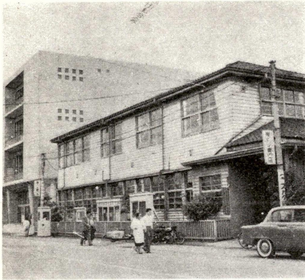
ひどくいたんでいる現庁舎、左側の建物は産業振興館

新庁舎は、産業振興館を残した現庁舎跡、約3千3百平方メートルの敷地に建設し、総工費は約8億5千万円。建築様式はビロツテ(ゲタバキ)方式で地下一階地上七階の鉄骨鉄筋コンクリート造り。地下には食堂・機械室・車庫などを設け、一階はおもに駐車場とし、2階から6階までが事務室、7階は約千人収容の区民ホールを設ける計画で