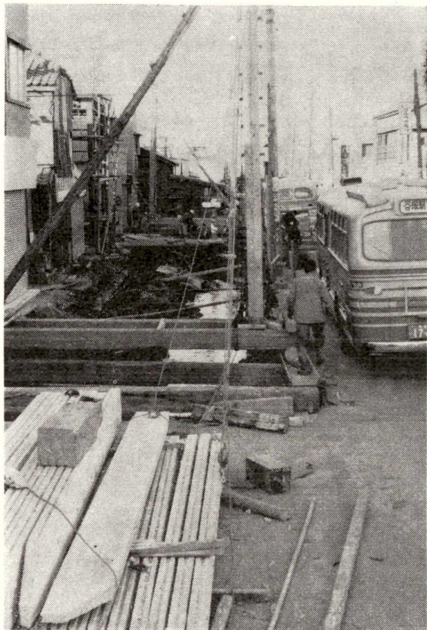
梅島町付近の暗きょ工事

この計画のなかで、区の事業外の都市計画街路事業（環7・放射11・12号線・補助100号ほか4路線）については都や国に強く要望して早く完成するようにし、下水道・工業用水道・高潮対策・中川改修・江北橋新橋などの事業も促進してゆこうという計画です。