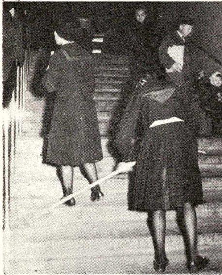
写真は、毎日北千住駅を掃除している潤徳学園の女学生

また、3月14日には、北千住駅前を中心として通行する人々に美化を呼びかけます。この運動をはじめてからすでに2年余りになります。毎