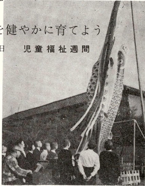
写真は、こいのぼりをあげる健全の家の子どもたち

柱の傷はおとしの「5月5日は端午の節句。空高く泳ぐこいのぼりのように元気で健やかにのびる子どもの成長を祝う日です。また、この日から児童福祉週間が始まります。