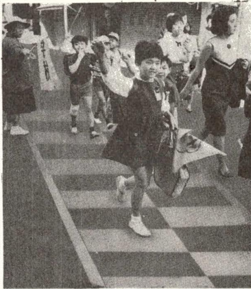
手をあげて横断歩道を渡りましょう

ことしの秋の交通安全運動も交通事故から守る運動を展開してまいります。 ①歩行者の安全な横断を確保すること。②自動車の完全整備。③安全運転の励行を重点目標として、9月25日から10月4日まで行なわれていた交通安全運動を一日もほかに足立区では、④子どもが早くなくすようにと、全国的の事故防止、を付け加え子ども組織で行なわれているものと、 ことしの1月から8月末までの交通事故は、各警察署の統計によると下表のとおり全体的に減っています。 このなかで、西新井、綾瀬署管内の死亡事故が減っていることが目立ちます。これは大きな交通事故がおもに日光街道に多いことから、信号機(2基)や横断歩道、街路燈の増設と歩道橋(2か所)を新設したことが効果をあげたことと考えられます。その