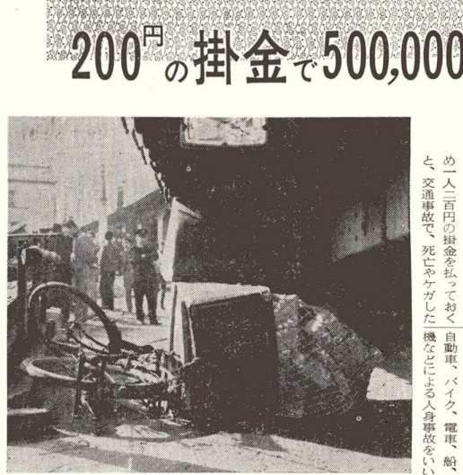
災害は、いつおこるかわからない

十月一日から 交通共済制度が発足 交通事故に備えて加入を この十月一日から「交通共済」が正式に発足します。この制度は、自動車・バイク・電車・飛行機・船舶等の交通手段を利用する際に発生する事故による被害に備えるための共済制度です。加入料は月額1,000円からと、比較的安価です。また、加入者には、自動車・バイク・電車・飛行機・船舶等の交通手段を利用する際の事故による被害に備えるための共済金が支払われます。加入料は月額1,000円からと、比較的安価です。また、加入者には、自動車・バイク・電車・飛行機・船舶等の交通手段を利用する際の事故による被害に備えるための共済金が支払われます。