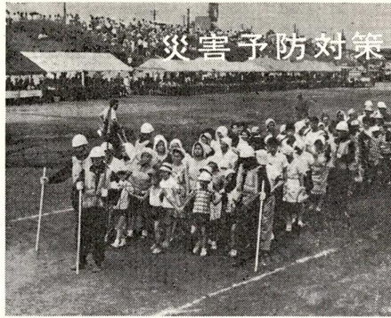
避難するときは秩序を守って……