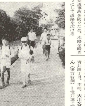
改修の方法としては、一、車の流れをスムーズにして交通事故を防ぐため、水路を暗さよにして道路を拡げる。

区が管理している水路二七五キロメートルのうち、改修が済んでいるのは、昭和四十四年三月末日現在、一一〇キロメートル(暗さよ三〇キロ、開さよ八〇キロ)で、改修率は三〇パーセント。