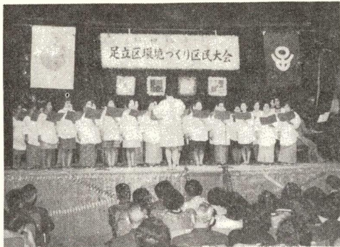
コーラスを楽しむお母さんが

区では、区民のみならず協力人が集まり、討論やコース・交して「新生活運動」を展開し、交通安全や公害などの運動の生活に努め、功労者の表彰などが行われ、 「新生活運動」を展開し、交通安全や公害などの運動の生活に努め、功労者の表彰などが行われ、 「新生活運動」を展開し、交通安全や公害などの運動の生活に努め、功労者の表彰などが行われ、