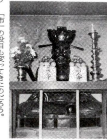
勝専寺のおえんさま様

旧道の西側中程の参道を進むと勝専寺である。今残る山門側の赤煉瓦壁には、 日光街道の歴史が記されている。本寺に ついては元暦の初撰内でも紹介した が、宿内も格式を誇り古刹である。先 で述べた丁目人別荘にも住持以下所化僧 三名、下名男、計六名が記載されてお り、しつと千住三丁目とつてはおえん ま様とは市の印象がなじみ深い。