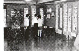
写真は昨年の区展風景

■展覧日時・場所 展覧時間：午前九時～午後六時 七月二十三日(土)～二十七日(土) 午前九時～午後七時 書道：七月二十三日(土)～二十四日(日) 午前九時～午後七時 七月二十八日(土)～二十九日(日) 午前九時～午後七時 ■提出日時・場所 提出時間：七月二十八日(土) 午後二時～七時 書道：七月二十八日(土)～二十九日(日) 午後五時～