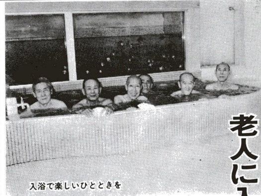
入浴で楽しいひとときを

7月1日の機構改革で 環境部は、環境の保全と公害の防止、防災対策の推進を図ります。環境課、公害課、防災課の3課を設け、それぞれが担当する業務を分担します。 環境課の業務：緑化係、衛生係、防振係 公害課の業務：大気汚染係、水質汚染係、防振係 防災課の業務：防火係、地震係、水害係