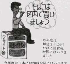
はばは区内で買います

区では、交通事故・病氣などで輸血が必要な方々のため、「愛の献血運動」を進めています。どうぞご協力をお願いします。 一月の献血日程 ▽八日(水) 区役所本庁舎 ▽十六日(木) 江北小学校 ▽二十日(月) 竹の塚駅東口 ▽二十四日(金) 弥生小学校 ▽二十八日(火) 東加平小学校 ▽三十日(木) 北千住駅西口 時間は、いずれも午前十時から午後三時(ただし、午前十一時三十分から午後三十分までは昼食休憩時間)までです。