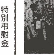
結婚記念樹の植樹

結婚記念樹コーナー 一ツ家中央公園に設置 去る三月二十九日、区立一ツ家中央公園 (東京都東區墨田区三丁目) に、結婚記念樹の植樹が行われました。四十九年からは、八百九十六組の新婚夫婦が記念樹を植えました。