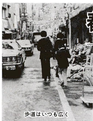
歩道はいつも広く