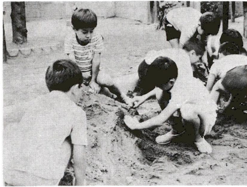
宿題は終わったし、いまは、みんなで遊ぶ時間

区では、毎年私立幼稚園や幼稚園類似施設に幼児を通園させている父兄(保護者)に、補助金を年間二回(分けて)支給しています。今回は、四月・九月の六か月分(前期)です。該当する父兄の方は、申請をお忘れなく、なわ、区内の幼稚園類似施設は、松山学園、黒田学園、永昌院童子園、花畑園地幼稚園の四園です。 補助金を受けられる父兄 ①昭和五十年四月一日以降、足立区の住民であること。 ②私立幼稚園または幼稚園類似施設に在園し、次の生年月日の幼児をもつ父兄。 補助金の額と支給時期 ①五歳児一人につき月額二千円 ②四歳児一人につき月額千円 交付時期 は、十月下旬の予定です。 受付期間 昭和五十年八月十五日(金)から九月五日(金)まで 申請の方法 ①足立区内の私立幼稚園および幼稚園類似施設の園児の保護者は、園に手続するようになります。 ②園からの連絡をお待ちください。 ③足立区外の区市町村にある私立幼稚園および幼稚園類似施設に在籍する園児の保護者は、本人が直接、区役所総務課係へ申請してください。(郵送による申請は、事故が多いため受けません。) ④直接園へ申請するときに必要なもの ▽印鑑 ▽園児在籍証明書(園児の生年月日)