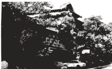
▲ 区民なら誰でも利用できます(区民保養所)