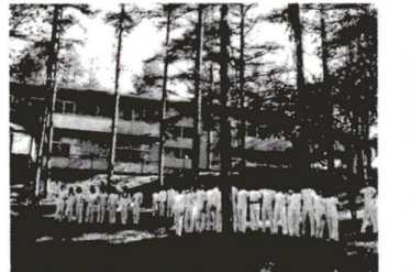
▲子どもたちの声がかどました山中湖林間学園