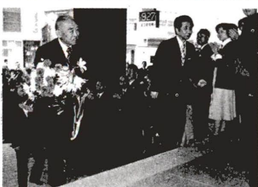
▲ 多数の職員を迎えられ、区長初登壇