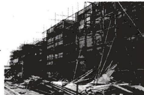
まだまだ作らなくてはならない学校