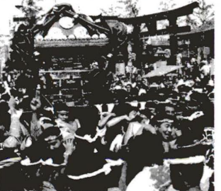
▲24年ぶりに姿をみせた450貫みこし