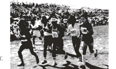
▲老いも若きもいっしょに(区民運動会)