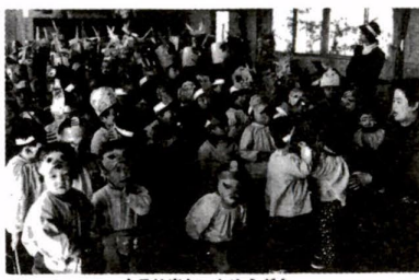
今日は楽しいおゆうぎ会

今年の四月一日に入園の保育園児の申込受付を、次のとおり行ないます。入園ご希望の方は、次の要領でお申込みください。 申込受付期間 一月十日(土)から一月二十四日(土)まで 申込場所 あなたのお住まいを管轄する、次の各福祉事務所へ。 ◇足立福祉事務所(千住柳町二二)