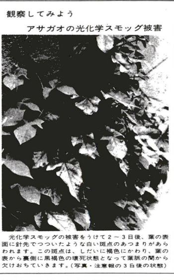
観察してみよう アサガオの光化学スモッグ被害