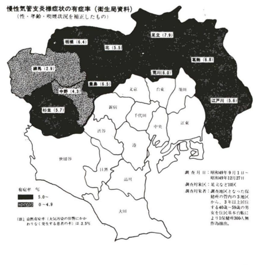
慢性気管支炎様症状の有症率(衛生局資料) (性・年齢・喫煙状況を補正したもの)

光化学スモッグの原因物質で、いおう酸化物とともに呼吸器疾患をひきおこすといわれる窒素酸化物は、いぜんとして、環境基準を大きく上まわっているため対策がいそがれています。都では、窒素酸化物を発生する工場のボイラー等の規制を、国よりきびしくするなどの対策で、東京に集中する汚染をやわらげる方針を打ちだしています。